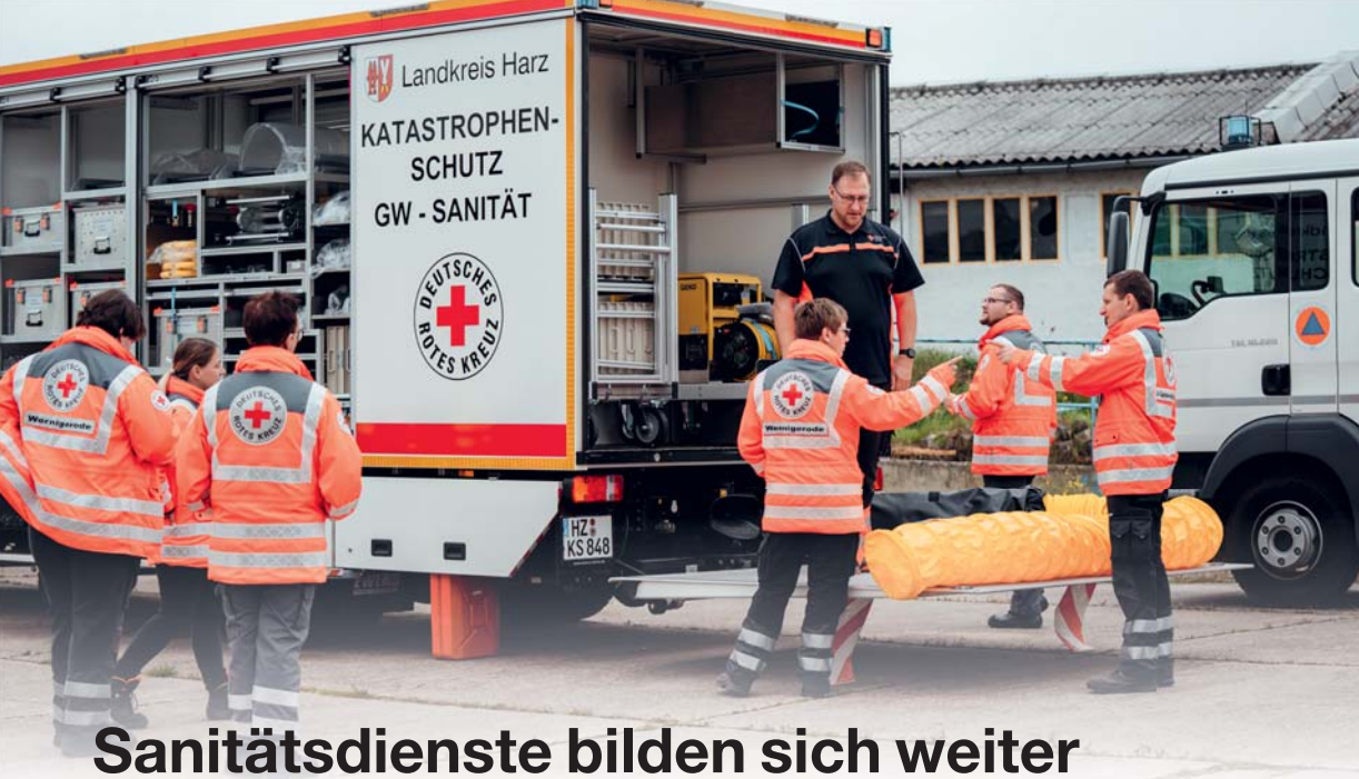
Insgesamt fünf Gerätewagen Sanität standen zur Schulung bereit.