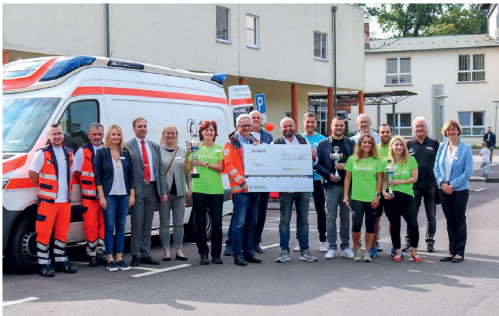
Der Spendenscheck wurde in der Helios Fachklinik Vogelsang-Gommern an das Deutsche Rote Kreuz übergeben.

Hier setzt eine Spendenaktion der Helios Kliniken für das DRK in Sachsen-Anhalt an. Die Mitarbeitenden der insgesamt acht Helios Kliniken im Bundesland liefen gemeinsam für den guten Zweck. Pro Kilometer wurde 1 Euro gespendet. Die erlaufenen 5.000 Euro wurden von Helios verdoppelt. Insgesamt 10.000 Euro kommen dem Bereich