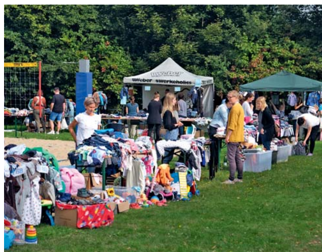
Gut gefüllter und besuchter Handelsplatz auf dem Außengelände der DRK-Begegnungsstätte Wormsdorf.