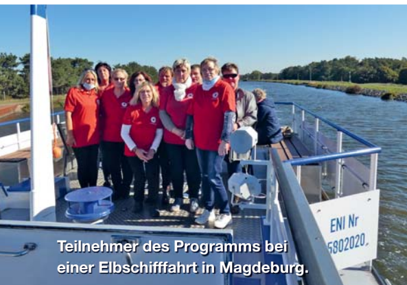
Teilnehmer des Programms bei einer Elbschiffahrt in Magdeburg.

Mit dem Patenschaftsprogramm „Menschen stärken Menschen“, gefördert durch das Bundesministerium für Familie, Senioren, Frauen und Jugend, wird bürgerschaftliches Engagement in Form von Patenschaften unterstützt. Ziel des Programms ist es, Menschen, denen eine Perspektive für die Zukunft fehlt und die durch andere Angebote schwierig zu erreichen sind, in die Gemeinschaft zu integrieren und ihnen die Möglichkeit zu gleichberechtigter Teilhabe am gesellschaftlichen Leben zu bieten.