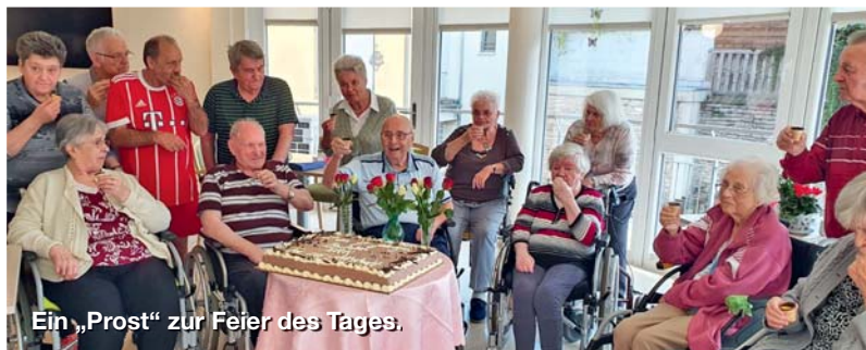
Ein „Prost“ zur Feier des Tages.

Das Team DRK Pflege- und Betreuungszentrum „Tor zur Altstadt“ Sangerhausen